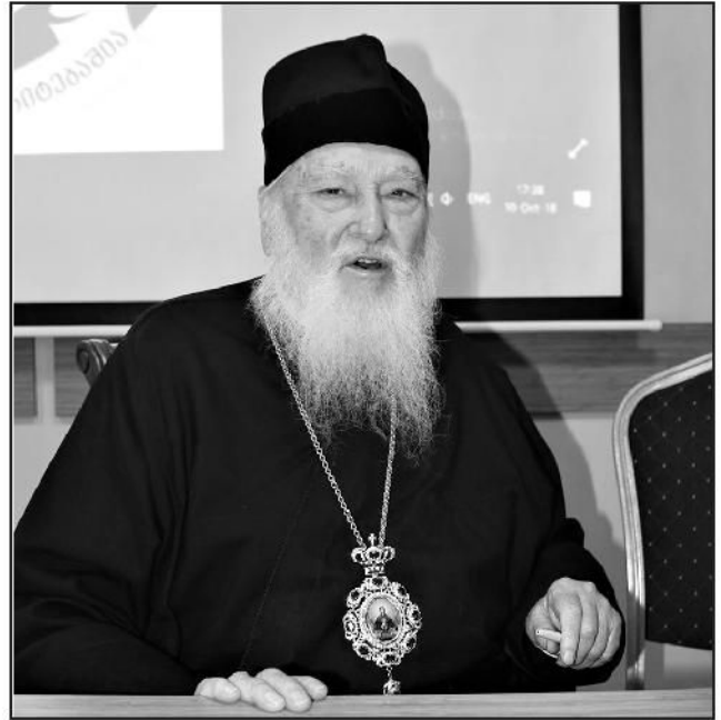
თეოლოგი კალისტოს უაარი

2018 წლის 9 ოქტომბერს ახალი საქართველოს უნივერსიტეტის დიდ საკონფერენციო დარბაზში გაიმართა საპატიო დოქტორის წოდების მინიჭების საზეიმო ცერემონია, რომელიც გახსნა ახალი საქართველოს უნივერსიტეტის კავკასიური ფილოსოფიისა და თეოლოგიის სამეცნიერო-კვლევითი არქივის დირექტორმა, პროფესორმა თენგიზ ირემაძემ. შესავალ სიტყვაში მან ამ დღის განსაკუთრებულ მნიშვნელობაზე ისაუბრა და აღნიშნა, რომ მეუფე კალისტოსისადმი საპატიო დოქტორის წოდების მინიჭებით ახალი საქართველოს უნივერსიტეტი მართლმადიდებლური საღვთისმეტყველო მეცნიერებების ერთ-ერთი ყველაზე ცნობილი და გავლენიანი წარმომადგენლის დიდ ღვაწლს აღიარებს და აფასებს. დიოკლიის მიტროპოლიტის სულიერ, საგანმანათლებლო და სამეცნიერო დამსახურებებსა და მიღწევებზე მოხსენება წაიკითხა ახალი საქართველოს