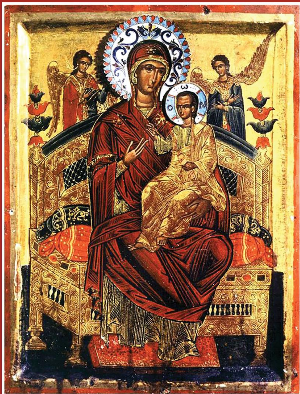
„კანთანასა“ — ყოველთა დედოფალი

6-12 დეკემბერი 2018 წ. გამოიცემა 1999 წლის 8 იანვრიდან ფასი 70 თეთრი